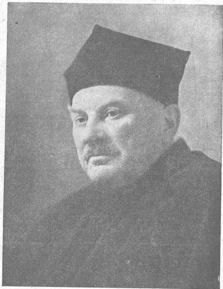
Dr Władysław Szafer, profesor Uniw. Jagiell.