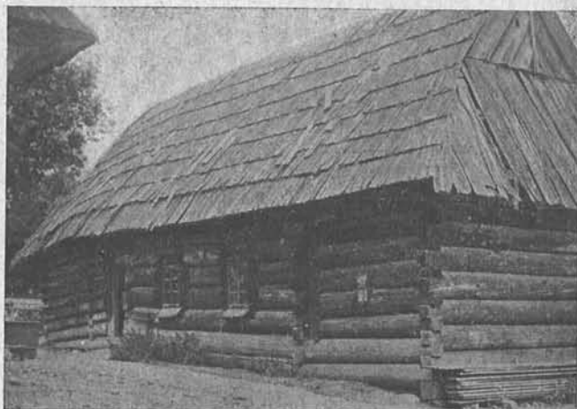
Najstarsza chata w Jurgowie.

jest jeszcze drewniana zapora. Ciekawa jest również w sieni drabina prowadząca na strych, sporządzona z drzewa zrośniętego. Obok drabiny znajduje się otwór prowadzący do „piekarnika“