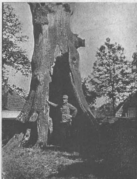
Dąb w Gidlach.