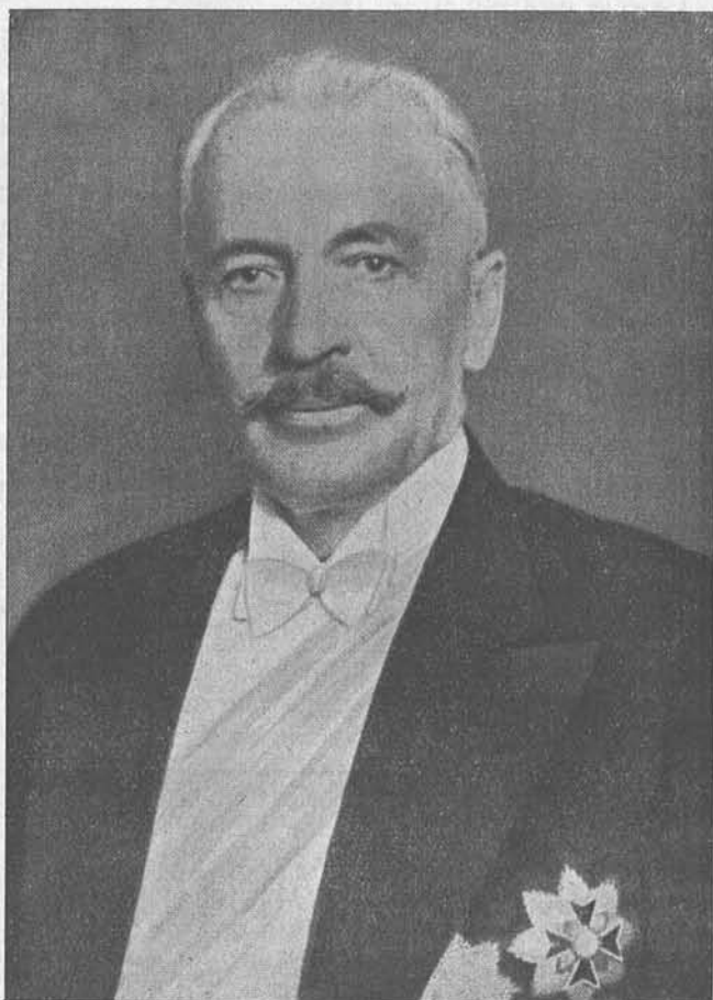
PREZYDENT RZECZYPOSPOLITEJ PROF. IGNACY MOŚCICKI.

MIESIĘCZNIK KRAJOZNAWCZY ORGAN KÓŁ KRAJOZNAWCZYCH MŁODZIEŻY POLSKIEGO TOWARZYSTWA KRAJOZNAWCZEGO